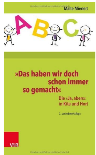
Bild: Das Buch zur Fachtagung vom V&B Verlag

Wenn Rechnungslegung gewünscht, bitte genaue Rechnungsanschrift angeben!